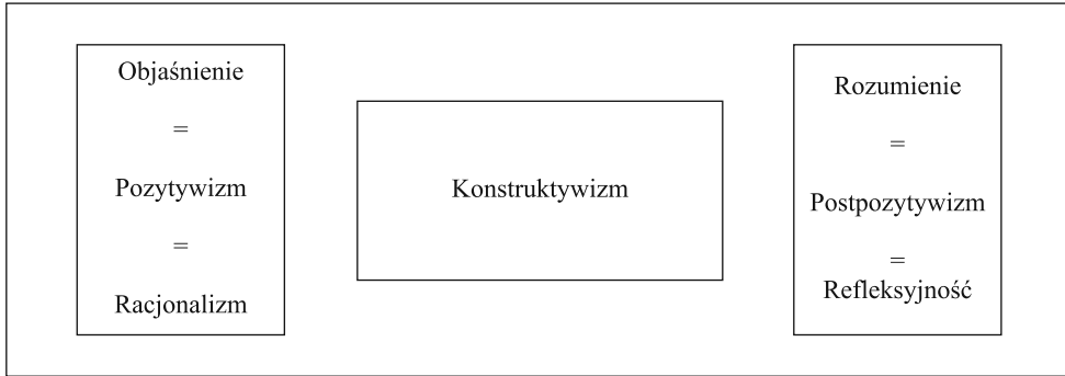
Rysunek 2. Struktura metodologii nauki o stosunkach międzynarodowych

i co określamy mianem międzynarodowości, suwerenności państw i anarchiczności systemu międzynarodowego. Morgenthau pisał przed laty, że stosunki międzynarodowe to dziedzina, w której zjawiska i procesy, jak np. równowaga sił, mają tendencję do powtarzania się, stąd możliwe jest odkrywanie empirycznie uzasadnionych wniosków i teoretycznej systematyzacji 36 .